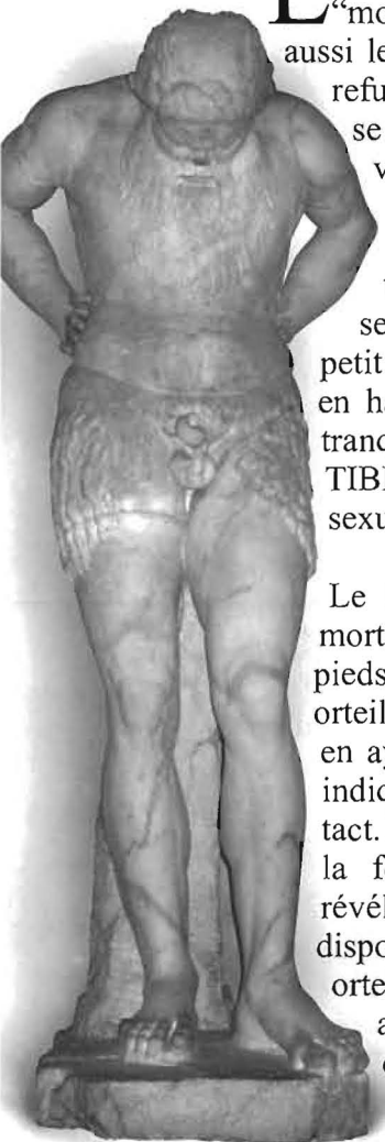
Satyre - Le Louvre