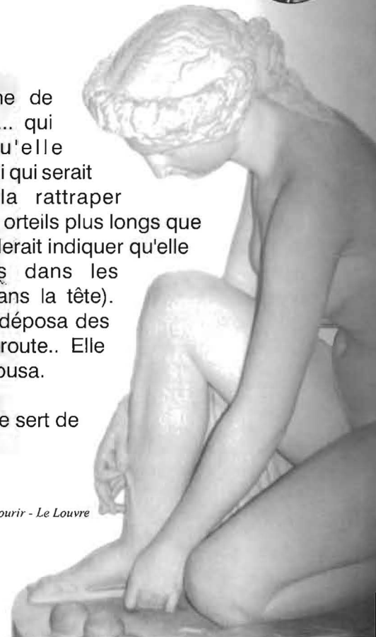
Rien ne sert de courir - Le Louvre